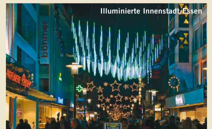
Illuminierte Innenstadt Essen

LIGHT WEEKS Breath-taking light installations: With the Essen Light Festival, Essen Light Weeks provide spectacular light art and effects during the otherwise dark time of the year.