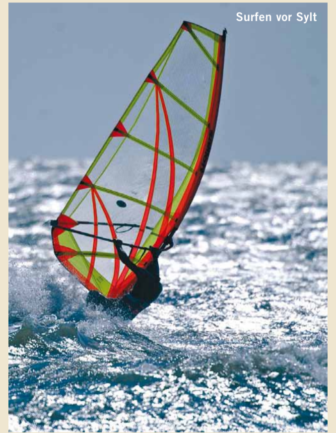
Surfen vor Sylt

MERCEDES-BENZ WINDSURFING WORLD CUP SYLT 10 days of sporting highlights, 210,000 visitors and around 160 surfers from 35 nations: As well as the impressive surfing performances against the coastal panoramic backdrop, guests can also enjoy culinary and entertainment highlights. Pop-up stores and other great events round off the programme.