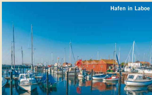
Hafen in Laboe

CHRISTMAS CITY OF THE NORTH A stroll around Lübeck Christmas market with its festive lights and magnificent historical scenery is one of the highlights of the run-up to Christmas in this Hanseatic city. Arts and crafts, toys and great gift ideas are available around Lübeck town hall and down to the Koberg as the scent of gingerbread, mulled wine and a wide range of other delicacies fills the air.