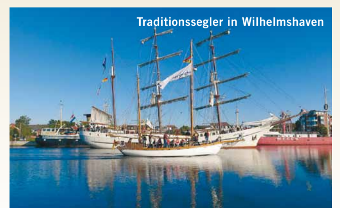
Traditionssegler in Wilhelmshaven

SAILING REGATTA IN THE JADE BIGHT The 17th Wilhelmshaven Sailing CUP takes place around the Great Harbour, offering visitors a taste of the exciting world of sailing ships. The additional range of events provides for varied entertainment with music, harbour cruises and activities for children.